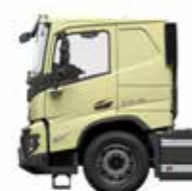
Cabina longa baixa