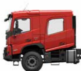
Cabina de passageiros